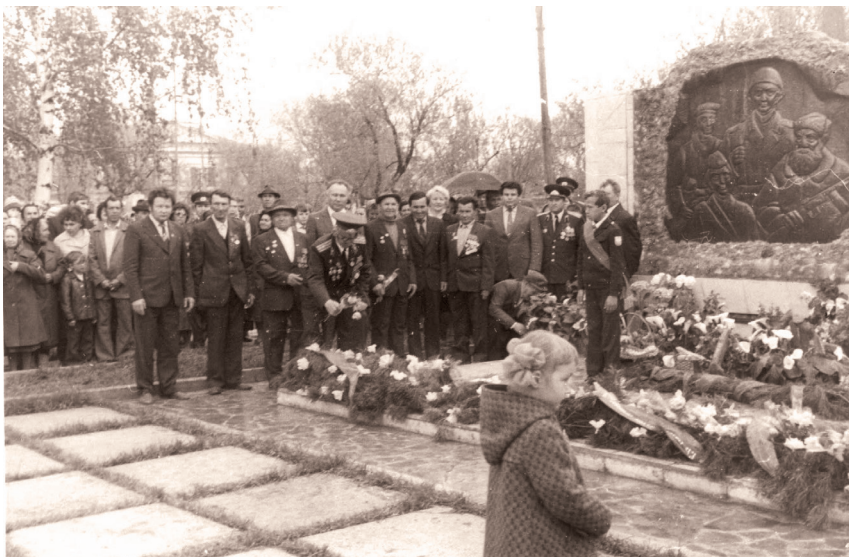
40 лет Победы. 1985 г.

Минуло 75 лет, но люди всегда благодарны тем героям, которые в жестокой борьбе с фашистскими захватчиками грудью защищали нашу Родину, трудились в эвакогоспиталях, зачастую на передней линии фронта, спасали жизнь многим воинам.