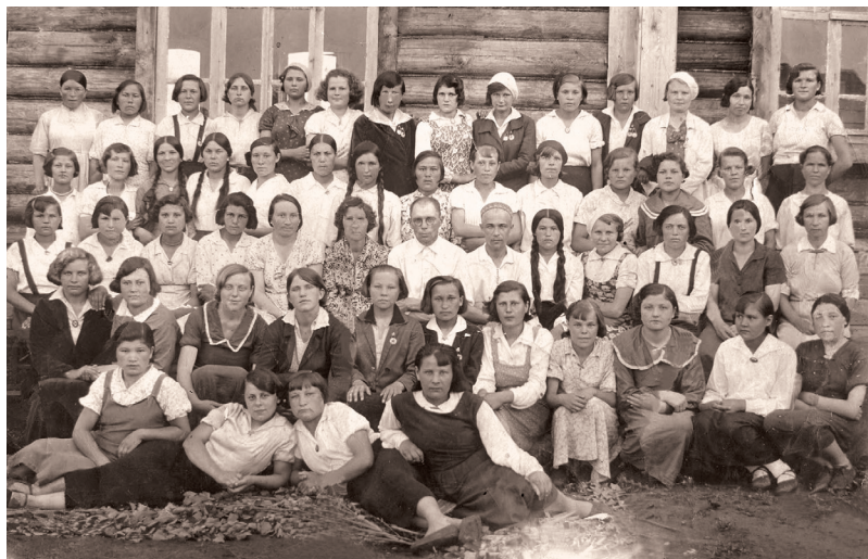
Первый выпуск школы медсестер. 1938 г.

Буинское медицинское училище является одним из старейших учебных заведений нашей республики. В 1936 г. в старом деревянном здании начала свою работу школа медицинских сестер с двухгодичным сроком обучения по адресу: ул. Энгельса, 52/50, о чем свидетельствует архивная справка Народного комиссариата здравоохранения ТАССР. В приказе от 17/VII-1936 г. № 321 есть такие строчки: «...Установить контингент приема по мед. школам на 1936/37 гг., а именно: ... во вновь организуемые 2-годичные школы медсестер ... в г. Буинске на базе Буинской больницы – 50 человек. Основание: 3-3959, оп. 3, д. 2, л.131,178. Директор ЦГА ТАССР А.Ж. Жиганшин. Зав. отделом информ. Н.Н. Иванова».