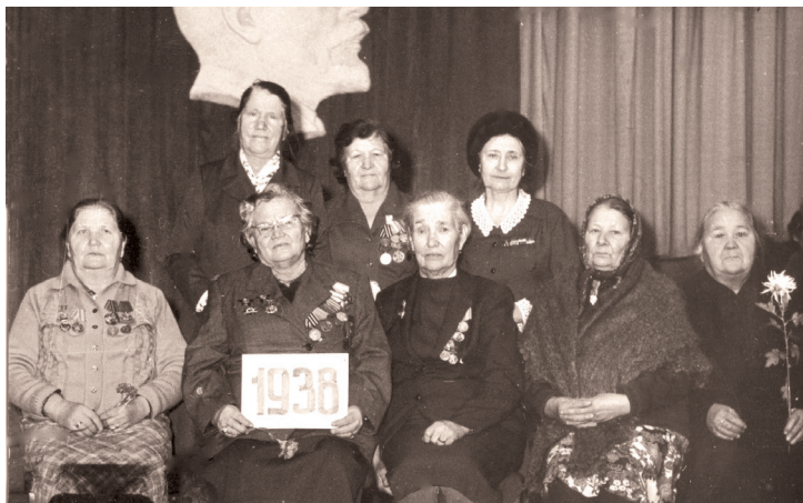
Традиционная встреча первых медсестер Буинского медучилища. 50 лет спустя. 1986 г.