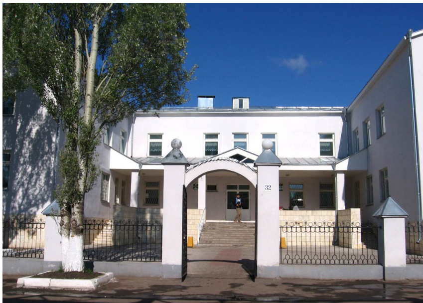
Новое здание Буинского медицинского училища

Подписано в печать 14.02.2020. Тираж 200 экз. Заказ 20-15